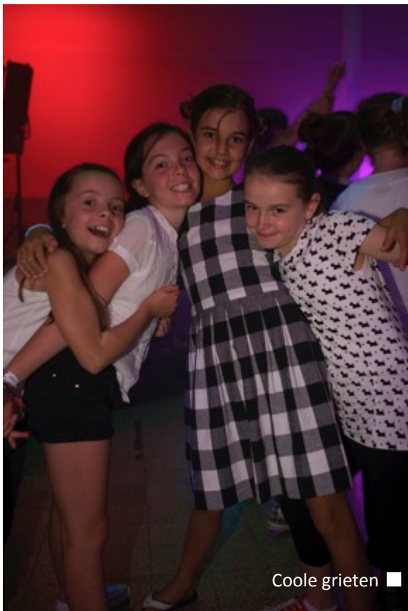
Coole grieten ■